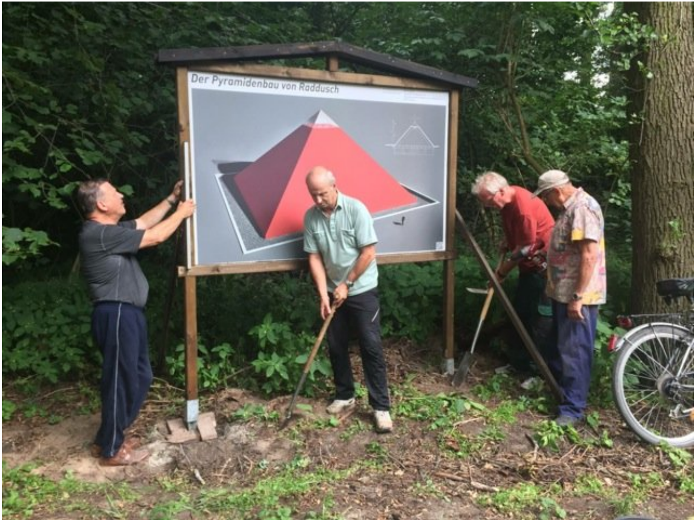
Mario Asef: Bautafel (2017).