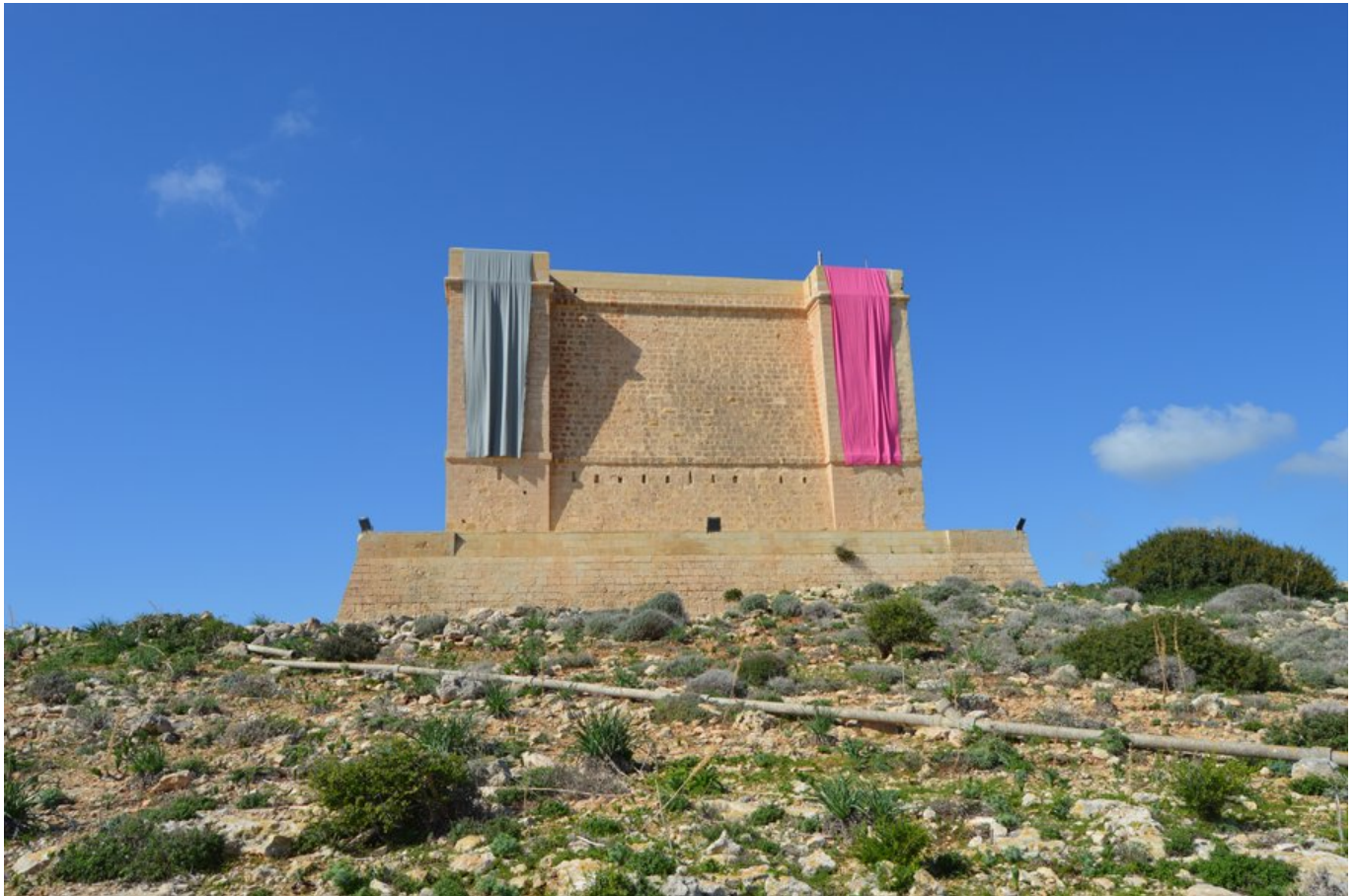
Mario Asef: St. Mary's Tower (2018).