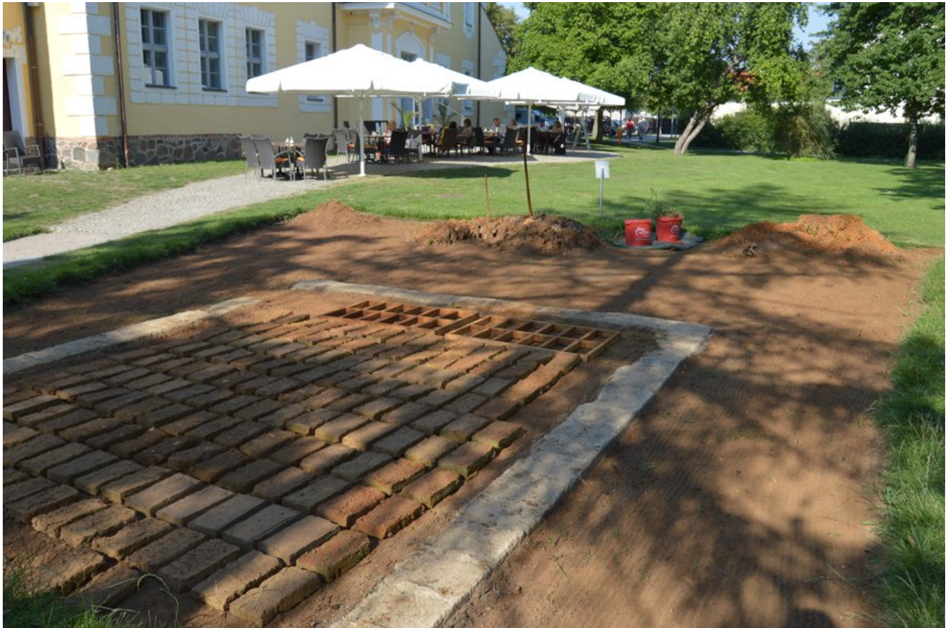
Mario Asef: Baustein-Produktion (2015).

Ihre Beschreibung lässt erahnen, dass Sie sich am Beispiel der Spree künstlerisch mit einem Umweltproblem, einem ökologischen Problem beschäftigen – mit den negativen Folgen des Kohleabbaus. Erläutern Sie bitte diesen Zusammenhang.