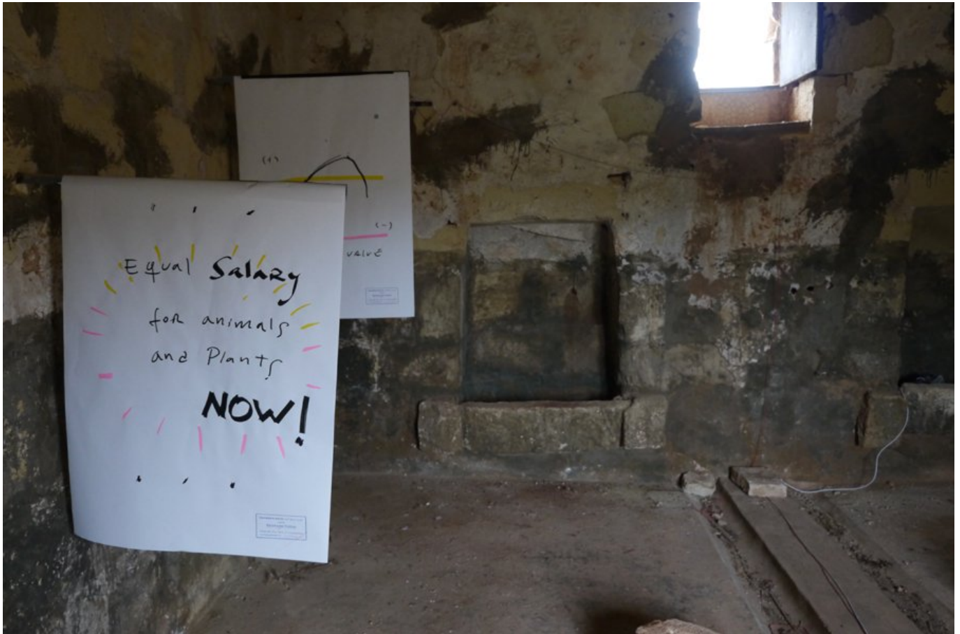
Mario Asef: Abandoned bakery (2018). Foto: Bettina Hutschek.